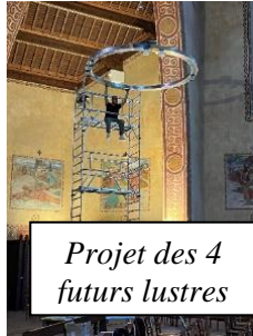
Projet des 4 futurs lustres